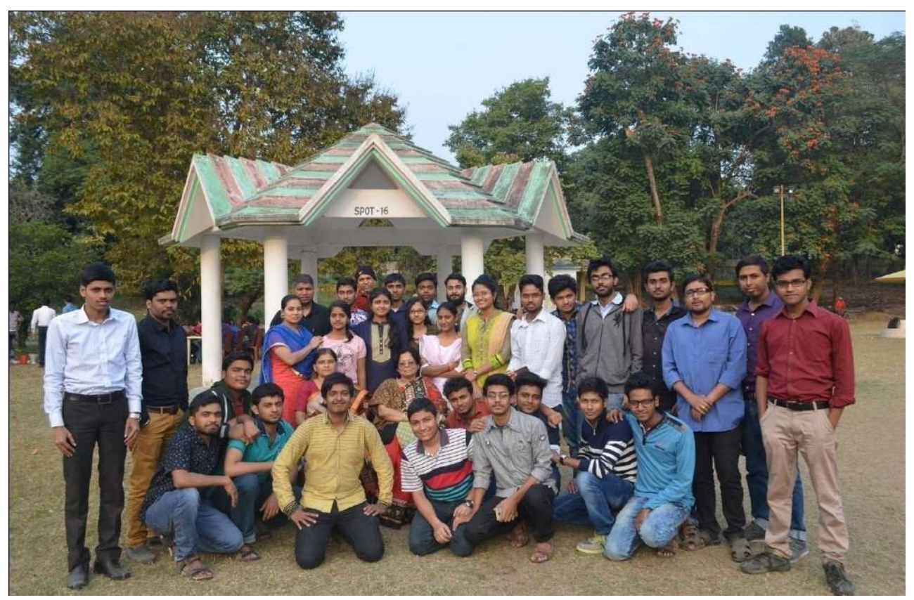
Top - Year: 2014; Bottom - Year: 2017.