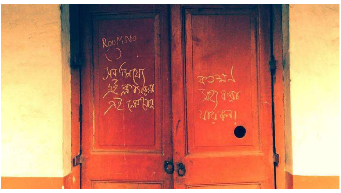
ছবি: কলেজের রুম নং ৫-এর।